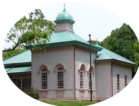
八幡山の洋館 国登録有形文化財(建造物)

070-6630-1953 (鈴木) chihopiano2016@gmail.com